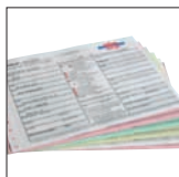
składanki oraz dokumentów przebitkowych