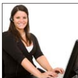
bezpośredniej obsługi klienta