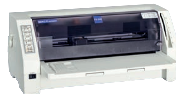
Widok FB-390 z przodu