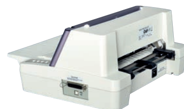
Widok FB-380 z prawej strony z gniazdami przyłączy