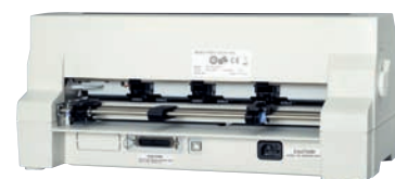
Gniazda przyłączy FB-390