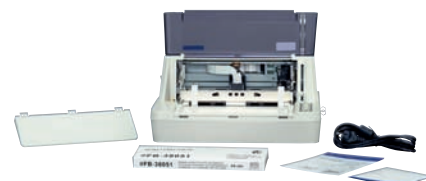
Schemat drogi prowadzenia papieru