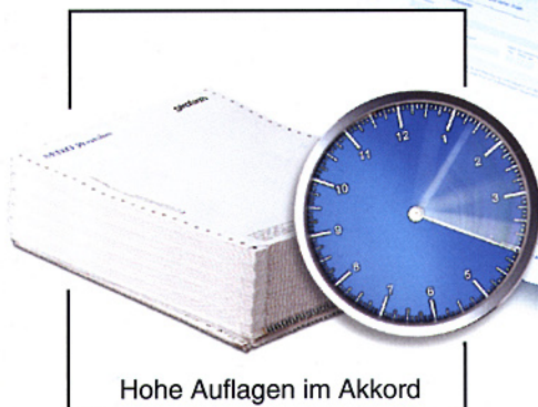
Hohe Auflagen im Akkord