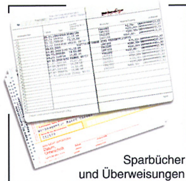
Sparbücher und Überweisungen

Ein Drucker der an Komfort nicht zu übertreffen ist!